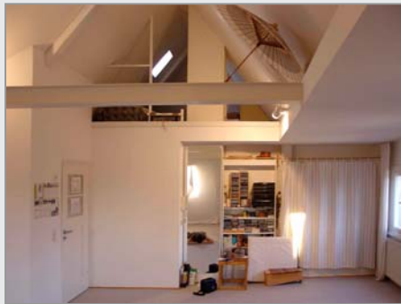
Tanzraum des ForumTanz in Villingen-Schwenningen

Wenn die Seele leidet oder der Alltag Schwierigkeiten bereitet, wenn man immer wieder an gleiche Grenzen stößt oder einfach mit seiner persönlichen Entwicklung weiterkommen möchte, bietet die Begleitung in Einzelstunden hierfür eine effektive Möglichkeit. Gearbeitet wird mit Methoden der Humanistischen Psychologie, der Tanztherapie, der Bewegungsanalyse, Focussing, Dialog mit dem Unterbewusstsein und mit Methoden aus dem Clarity Process®.